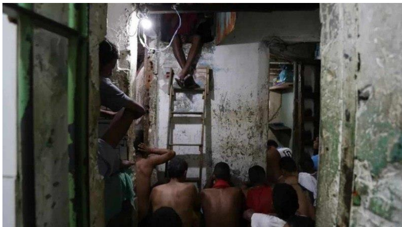
Figura 2: Após 2 meses, só 10% dos presos deixaram o Complexo Prisional do Curado, no Recife.

Desta forma, a dignidade humana integra as normas de direitos humanos fundamentais, sendo o art. 5º, III, CF que: ninguém será submetido à tortura nem a tratamento desumano ou degradante.